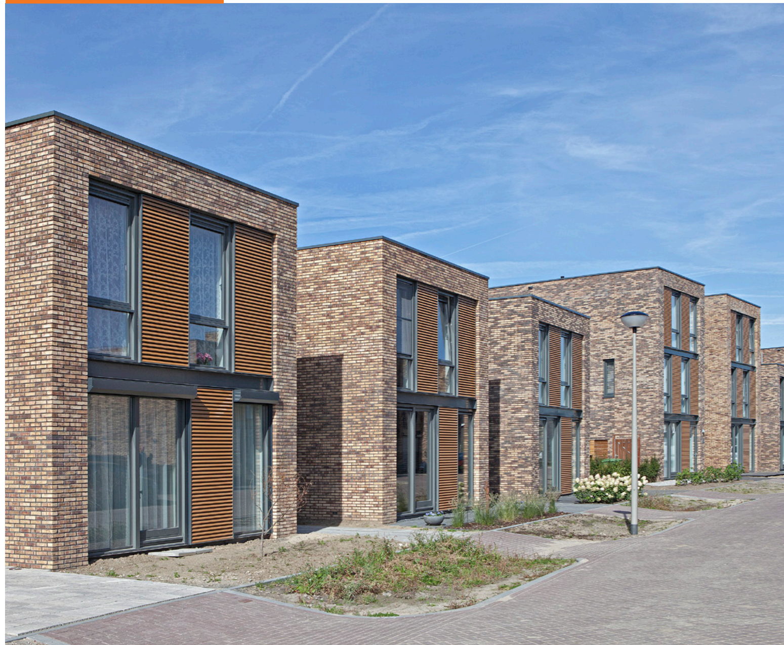
NEGENTIE EILANDWONINGEN, ZUYDEREILAND IN DE WIJK SCHUYTGRAAF, ARNHEM