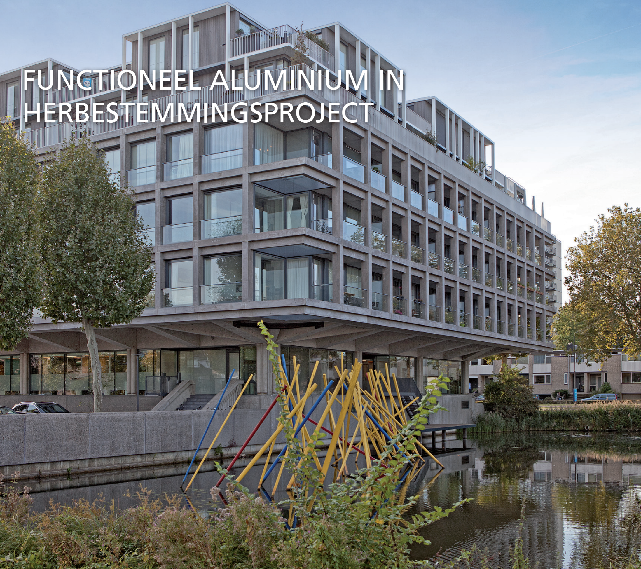
VOORMALIGE KANTOORGEBOUW VAN RIJKSWATERSTAAT, ZUID073 SCHUBERTSINGEL, DEN BOSCH