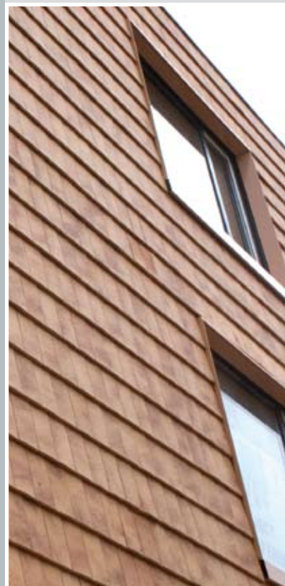
VERZORGINGSTEHUIS VELSERDUIN IN IJMUIDEN

Stijl, functionaliteit, esthetische eigenschappen... het speelt allemaal een rol bij de keuze voor waterslagen, muurafdeksystemen of daktrimmen, geanodiseerd of gemoffeld, afwijkende maatvoering of brute uitvoering... Als specialist bij uitstek adviseert Roval hierin, zowel naar de uitvoerder als naar de architect. Soms voldoen standaardproducten niet en is maatwerk nodig. Ook hierin kunnen bouwpartners blind varen op de kennis en kwaliteit van Roval. Een perfect resultaat begint immers met een goed advies.