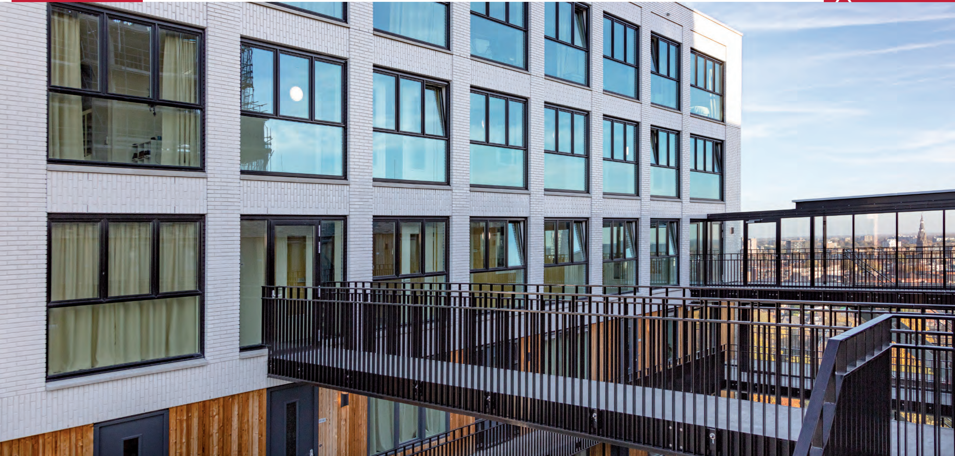
LUX TOWER, STRIJP-S, EINDHOVEN